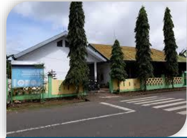
SMKS Muhammadiyah Watansoppeng Sulawesi Selatan