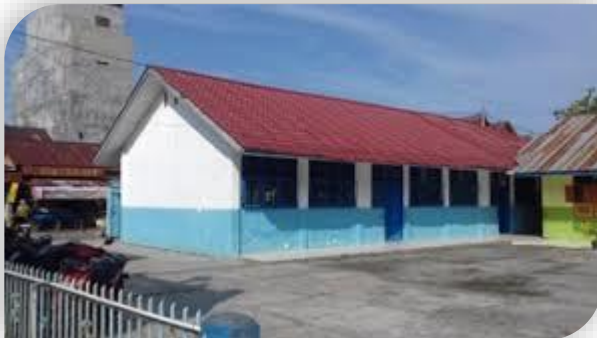
SD Muhammadiyah Barus Pasar Tapanuli Tengah