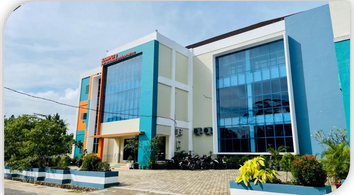
SMP Muhammadiyah Ahmad Dahlan Metro