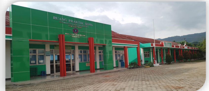
SMK Muhammadiyah 1 Cimanggu Cilacap