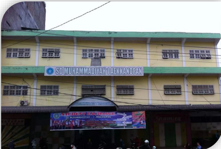
SD Muhammadiyah 1 Aekkanopan Deli Serdang