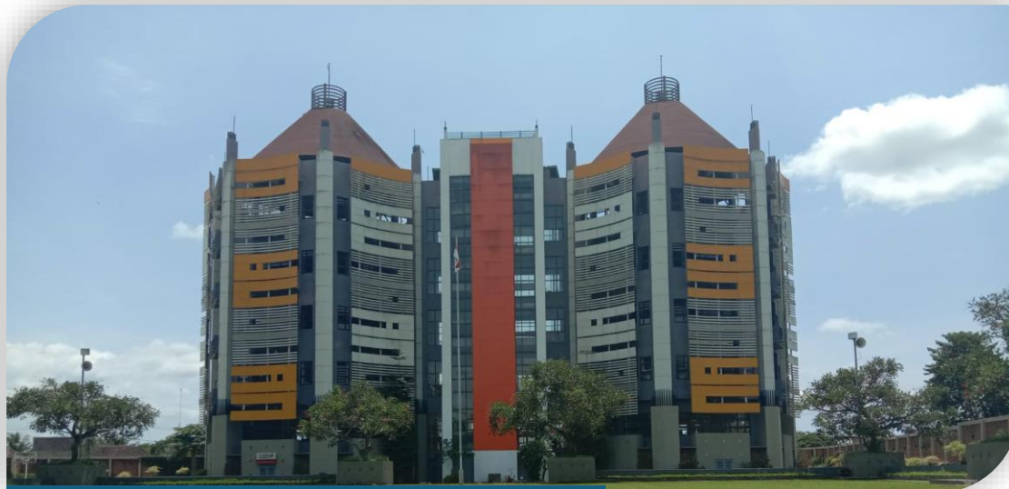
SMK Muhammadiyah 7 Gondanglegi