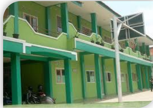
SMP Muhammadiyah Cikoneng Ciamis