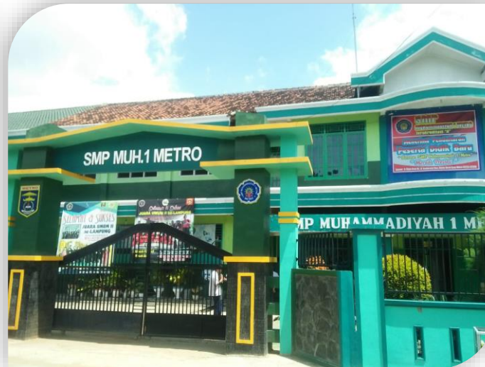
SMP Muhammadiyah 1 Metro Lampung