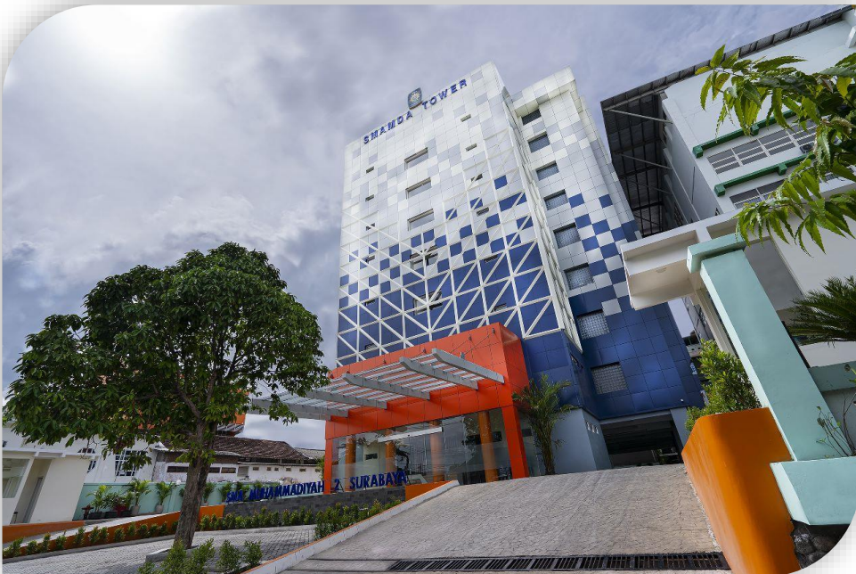
SMA Muhammadiyah 2 Surabaya