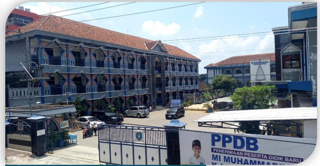
MI Muhammadiyah Karanganyar