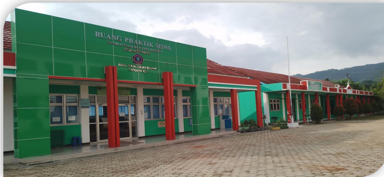
SMK Muhammadiyah 1 Cimanggu Cilacap