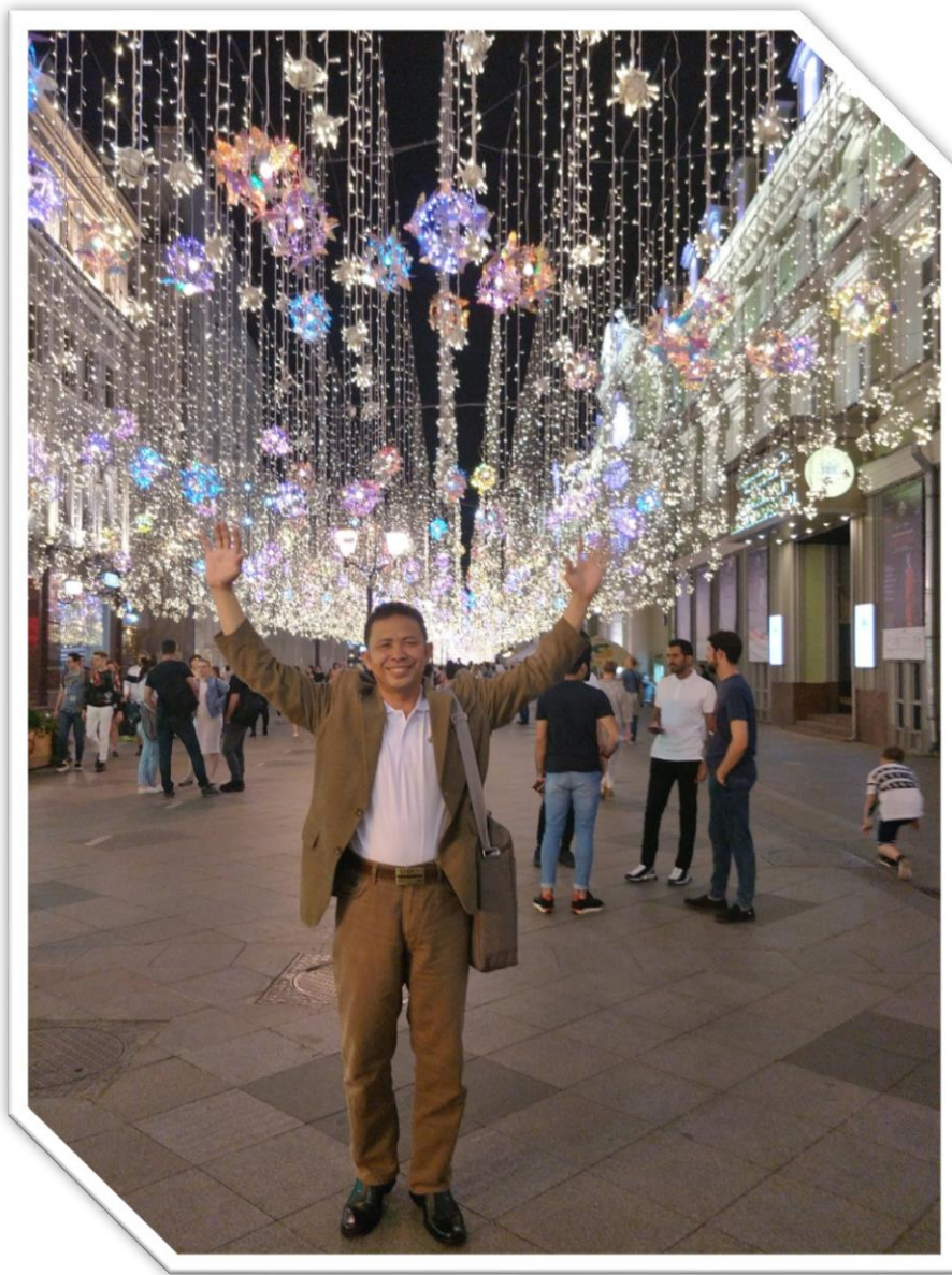
MOSKOW RUSIA 2019