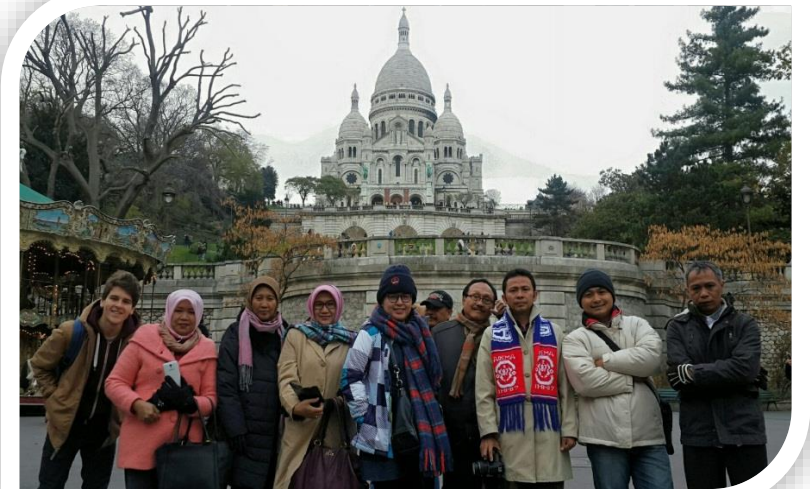
PARIS PRANCIS 2015