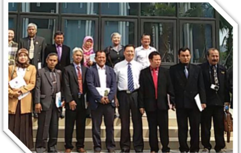
GUANGZO CHINA 2016