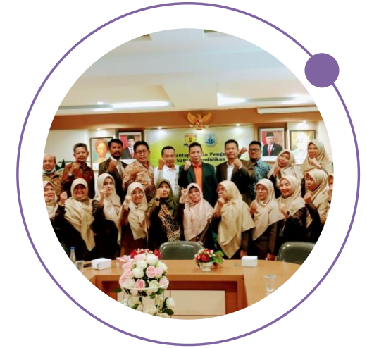
JUMLAH SISWA DI BAWAH 100