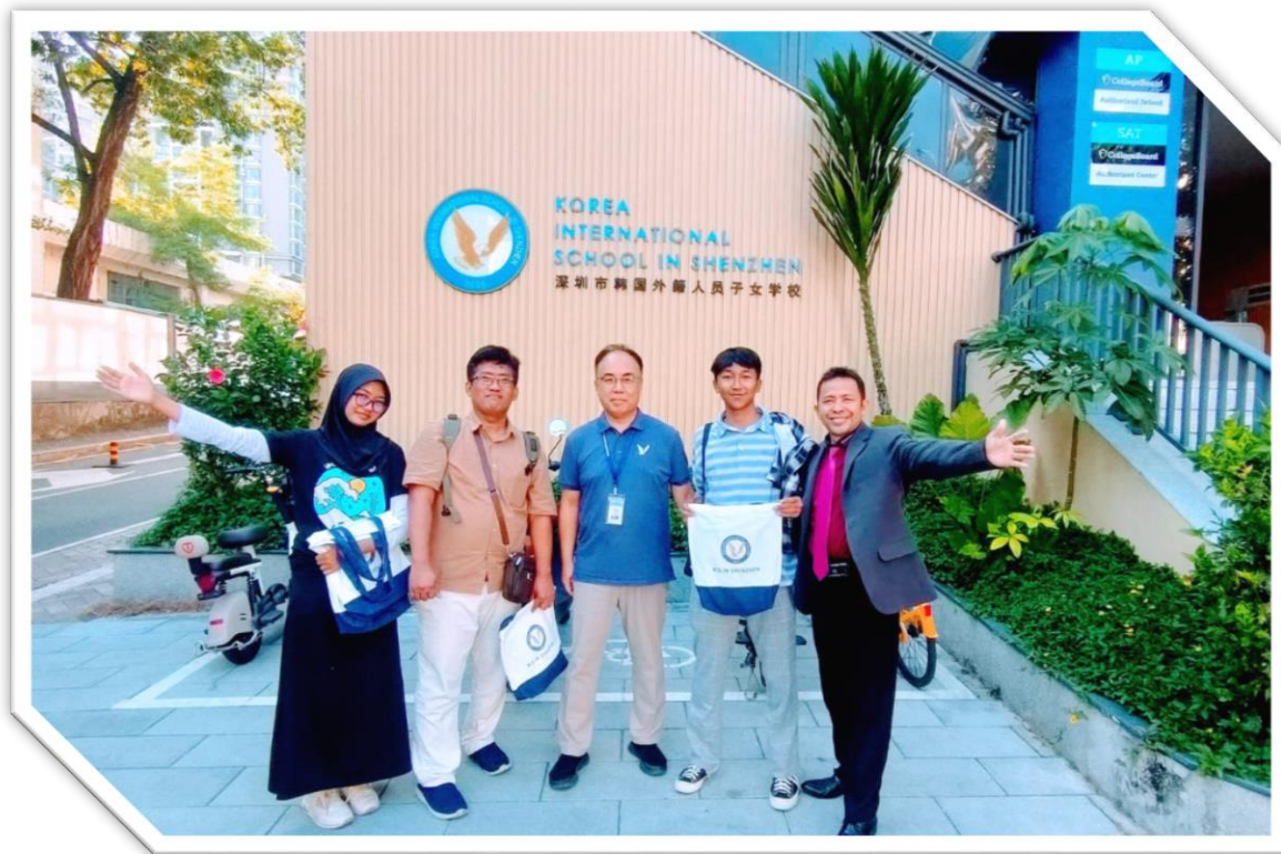
KOREA INTERNATIONAL SCHOOL (KIS) SHENZHEN GUANGDONG CHINA 21 - 27 SEP 2023