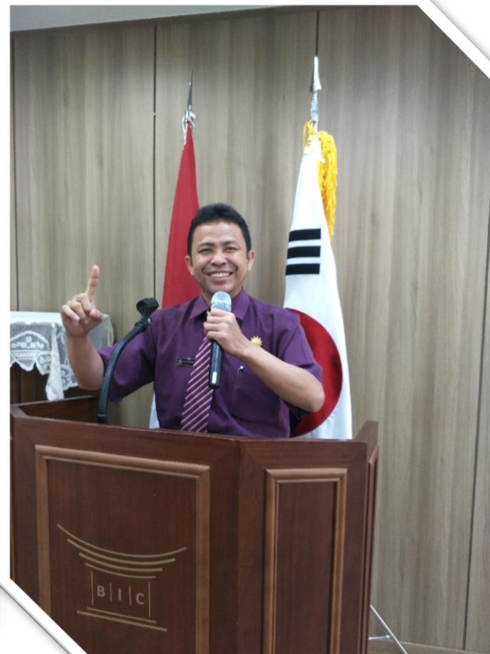
BUSAN INDONESIAN CULTUR (BIC) KORSEL 2017