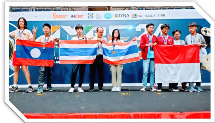
MEDALI EMAS DAN PERAK DALAM INTERNATIONAL YOUTH ROBOTIC COMPETITION 2024 JOHOR MALAYSIA