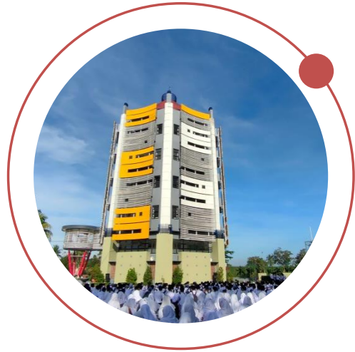
JUMLAH SISWA SD/MI, SMP/MTs, SMA/MA/SMK