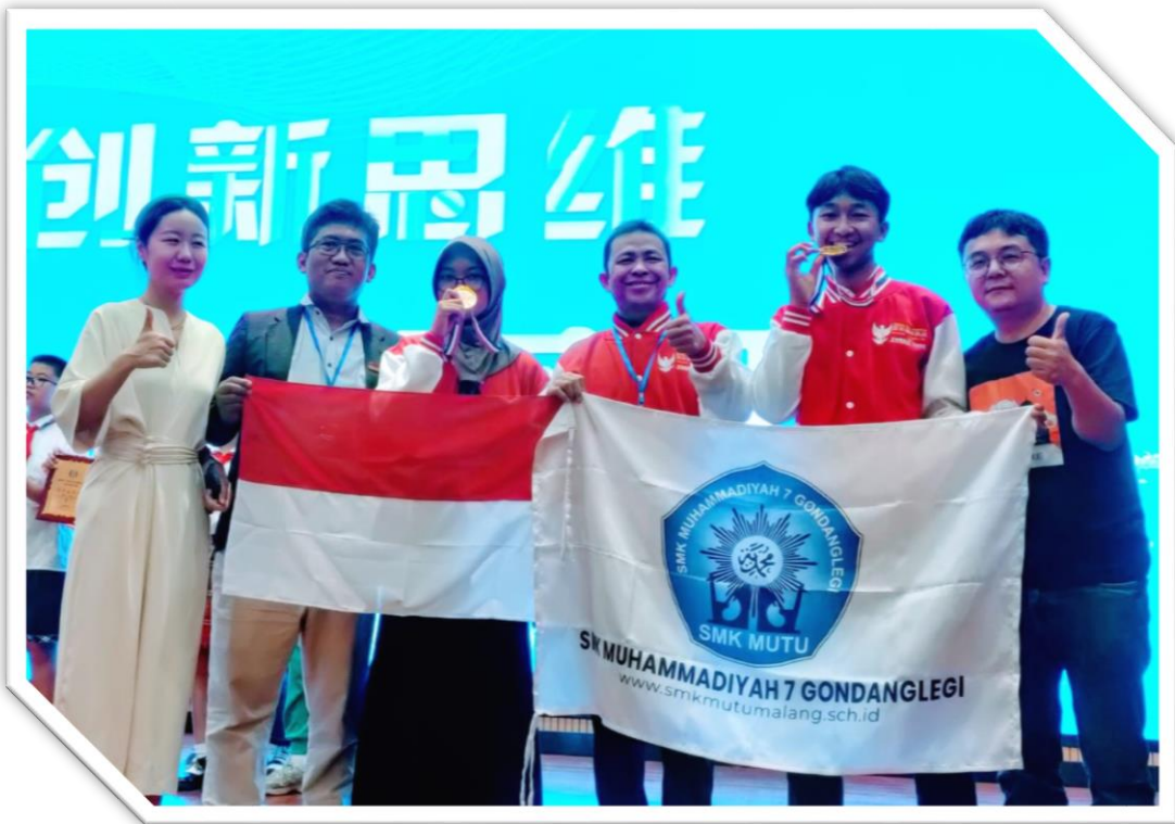
GOLD MEDAL INTERNATIONAL ROBOTIC COMPETITION GUANGZHOU CHINA 21-27 SEP 2023