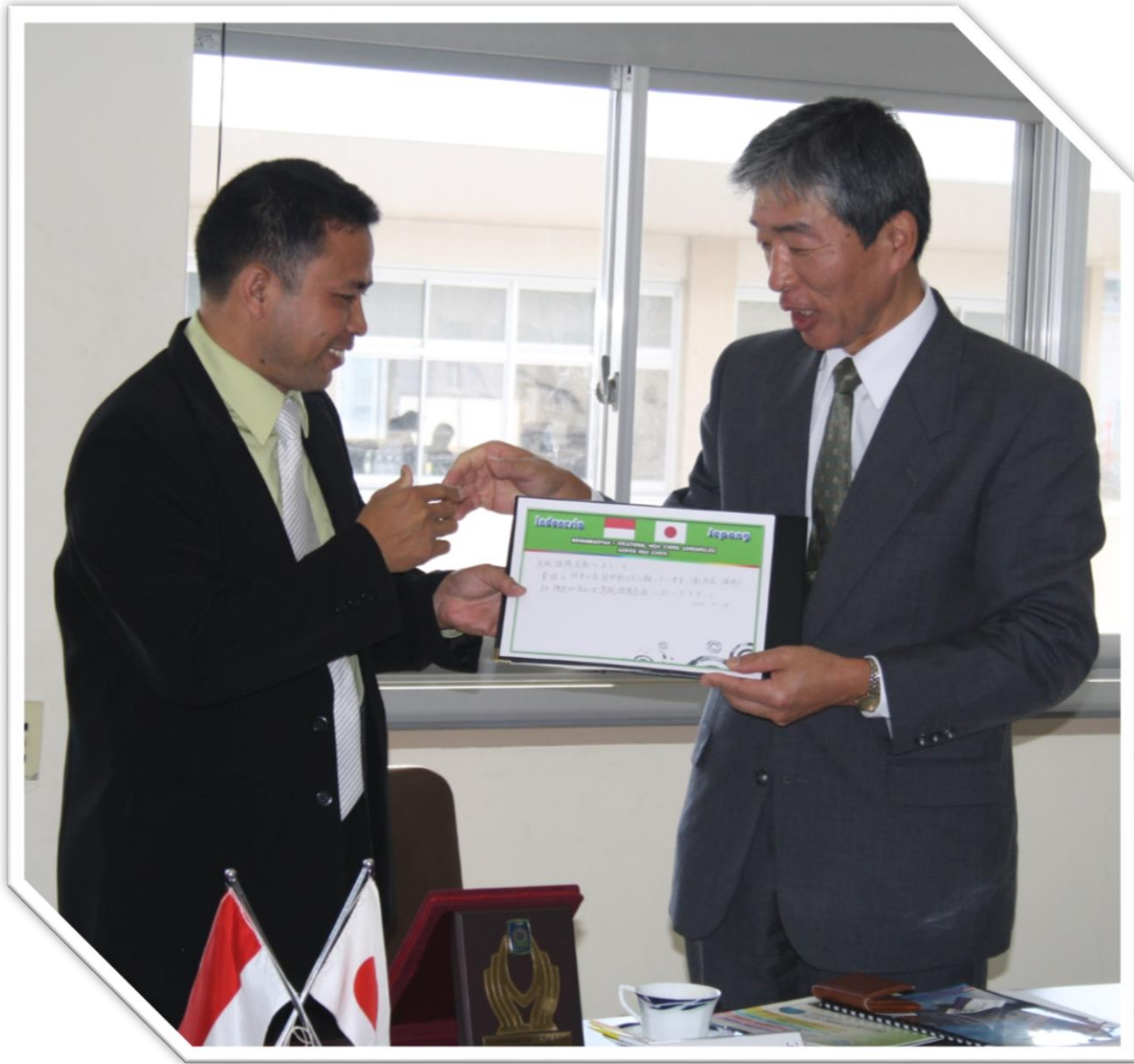
OSAKA JEPANG 2014