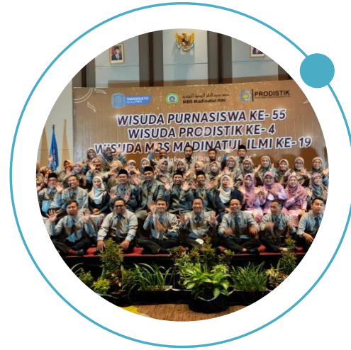
JUMLAH SISWA DI ATAS 100